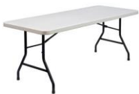
Table rectangulaire (0.80 x 2m) 12€

Tarif B : 100€ si exposant propose une animation costumée sur 2 jours